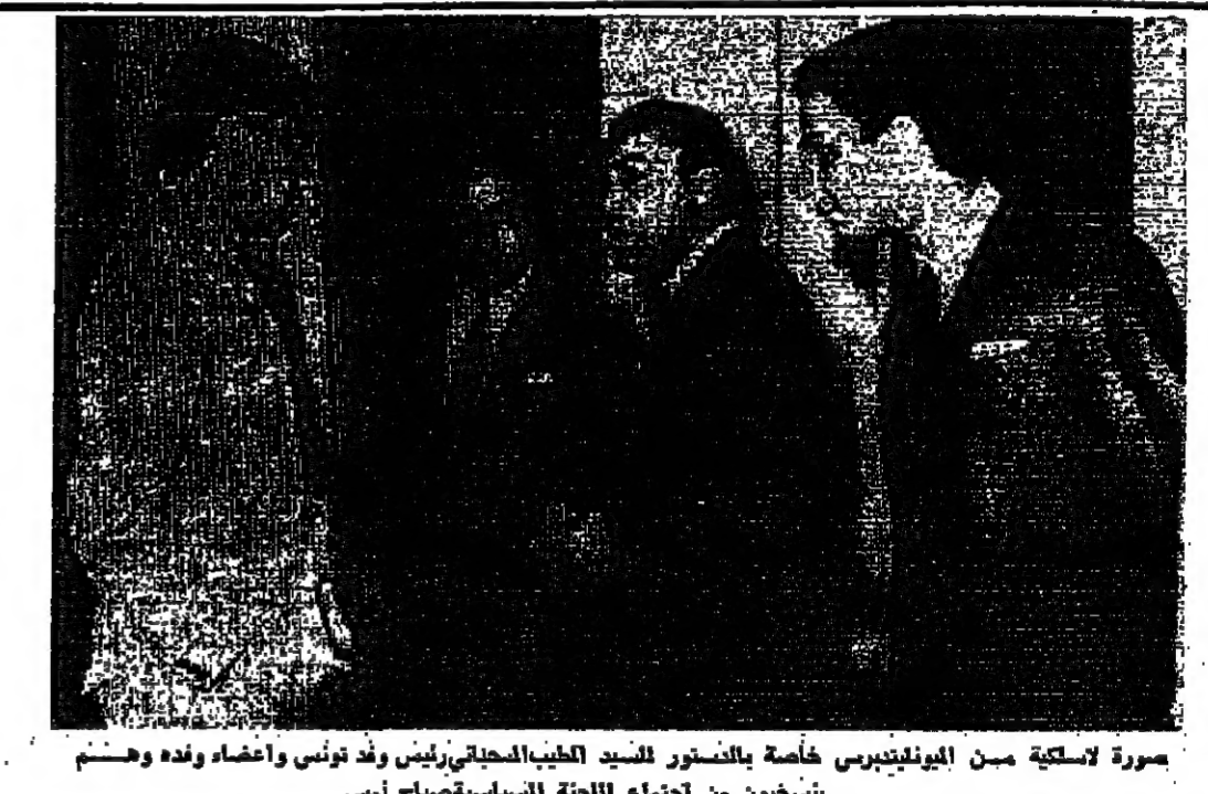
صورة لاسكيتا من اليونانيات خاصة بالدستور السيد الطبيب السياسي رئيس وفد تونس واعضاء وفده وهم يتشاورون من اجتماع اللجنة السياسية صباح امس

مجلس ينفق اليوم - تحديد ولاية حسونة سنة القاهرة - برقيا من أمين القطب - رويتر - وكالات الانباء - وقع ما كان يخشاه المراقبون الدبلوماسيون واعتبروه حدثا مؤسفا في هذا الوقت بالذات الذي يتطلب اكثر من اي وقت مضى وحدة الصف والكلمة والجهد عندما انسحب الوفد التونسي من اجتماعات مجلس الجامعة العربية وغادر القاهرة عائدا الى بلاده . سبب الانسحاب وقد جاء انسحاب الوفد التونسي برئاسة السيد الطبيب السياسي سفي تونس في ليبيا من الجلسة الثالثة التي عقدها اللجنة السياسية صباح امس برئاسة اللجنة على الصفحة الرابعة عمود ٧